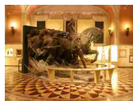
MUSEO CENTRALE DEL RISORGIMENTO