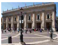
MUSEI CAPITOLINI - PALAZZO DEI CONSERVATORI