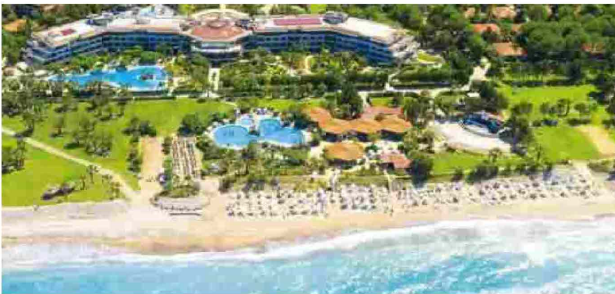
Il Veraresort Grand Palladium di Cefalù