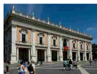
PALAZZO DEI CONSERVATORI